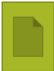
היפר קישור עמוד 11