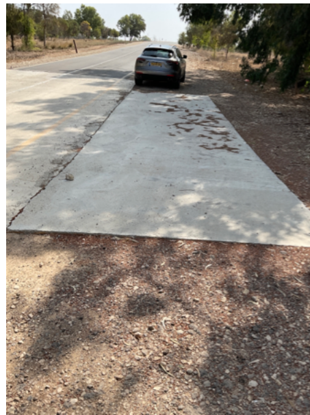
18. הסדרי תנועה זמניים כולל אישור של מהנדס תנועה והמועצה כלולים במחיר היחידה. כביש פעיל מאוד וחייב להיות פתוח 7*24