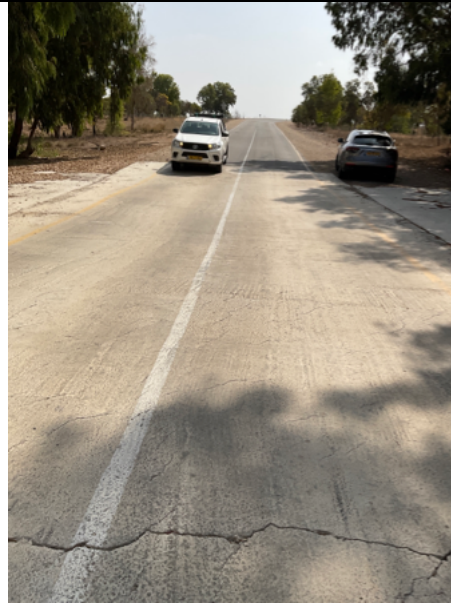
17. סעיף ריפראפ הכוונה למשטח בטון בעובי 15 ס"מ