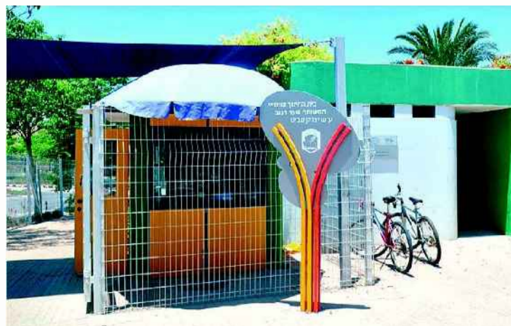
בית הספר היסודי בשער הנגב. שורות מיגוניות ארוכה בכניסה

"רמאללה, רמאללה", צועק אחד. "באר שבע, באר שבע", עונה חברו, וכך הלאה. אני יושב איתם בסככה. בהתחלה אף אחד לא מדבר איתי, אבל בסוף הם נפתחים. רמדאן עכשיו ואני מרחם עליהם קצת, לא קל לצום בחום הזה. אדם מבוגר מבית לאהיה מצפון הרצועה שנכנס לקבל טיפול ברגליו, מספר שאין עבודה ואין מה לאכול. כולם